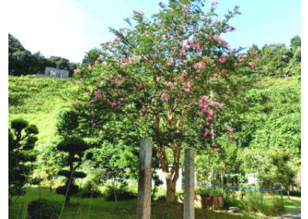
【夏空に映えるサルスベリ】

長かった夏休みが終わり、今日から2学期が始まりました。子どもたちは「おはようございます。」と元気に登校し、学校に活気が戻ってきました。子どもたちにとって有意義な夏休みになったことに対し、厚くお礼を申し上げます。一人一人の子どもたちが、日々の家庭でのお手伝い、お盆の行事、ラジオ体操や地域行事への参加等を通して感じた感動や喜び、楽しさ、次への意欲等学んだことを発表し合っ、教室や全校でその思いを分かち合うことができうれしく思います。